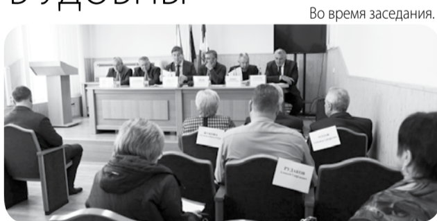
Во время заседания.

Среди озвученных в ходе заседания сложностей - «дублирование» маршрутов, нежелание перевозчиков работать на менее прибыльных направлениях, отсутствие транспортного сообщения для удалённых населённых пунктов. При этом отмечалось, что после начала субсидирования краем межмуниципальных перевозок и при-