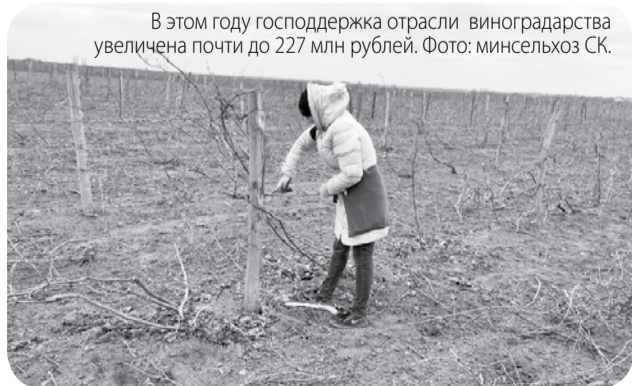
В этом году господдержка отрасли виноградарства увеличена почти до 227 млн рублей.

По информации краевого минсельхоза, начался первый этап освобождения виноградников от земли, защищающей их от морозов. Пока к работам приступили аграрии Левокумского и Петровского округов. В целом работы запланированы на площади 1,3 тысячи га.